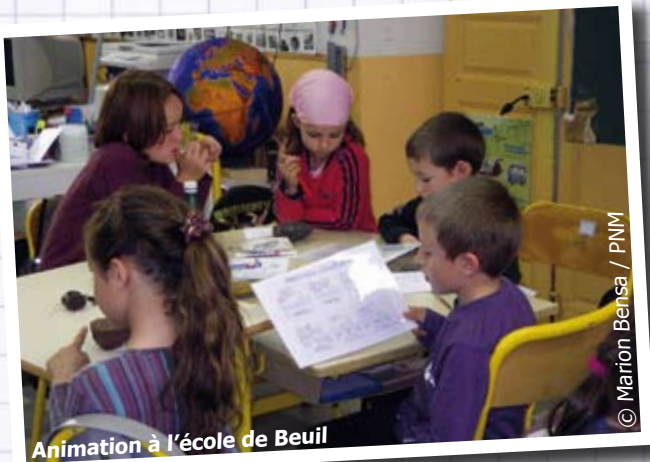
Animation à l'école de Beuil

Cette année, les élèves du canton de Guillaumes étudient les roches de leurs vallées et la formation des paysages. Ils sont amenés à réfléchir à la couleur et à la forme des cailloux, à l'origine des fossiles ou encore à l'évolution de la Terre. Grâce à des maquettes, des expériences et des jeux de rôle, le Parc national du Mercantour initie les enfants à la géologie par une animation dans chaque classe volontaire.