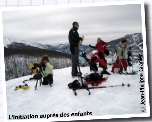
L'initiation auprès des enfants

Contact : 06.62.10.66.15 ou wombatrescue@hotmail.fr