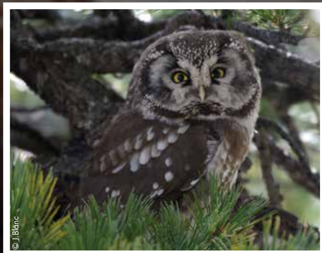
Dans les forêts de montagne du Mercantour, on rencontre la chouette de Tengmalm, une espèce particulièrement adaptée aux conditions de vie rudes et froides d'altitude.

Ces rapaces nocturnes (comme la chouette hulotte ou le hibou grand-duc) sont de redoutables chasseurs la nuit et se reposent le jour. Grâce à leur plumage qui absorbe le bruit quand ils volent, leur vue excellente dans le noir et leur ouïe exceptionnelle, ils capturent principalement des petits rongeurs (musaraigne, campagnol, souris...).