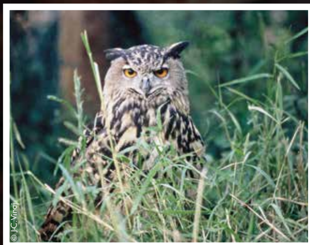
Un hibou grand-duc