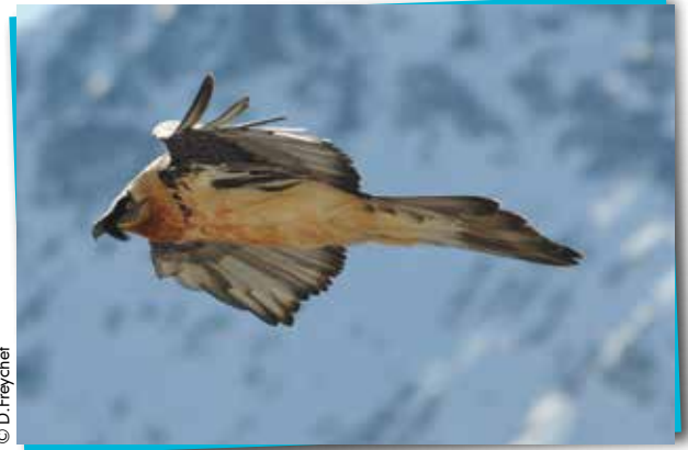
Photo d'un adulte